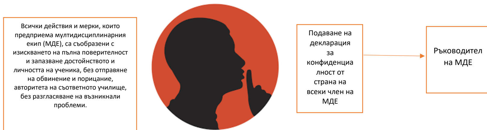
СХЕМА: Стъпка 6: Поверителност