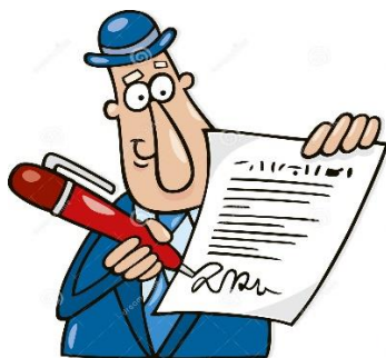
СХЕМА: Стъпка 7: Процедура по информиране на родителите

Директорите на училищата са длъжни да запознаят родителите с влезлите в сила Указания за действие при работа в случаи на разпространение, употреба и/или държане с цел разпространение на наркотични вещества или техните аналози в училищата и прилежащата им територия.